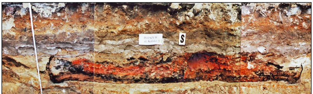
Kaliska 32 profil południowy, budowla mieszkalna