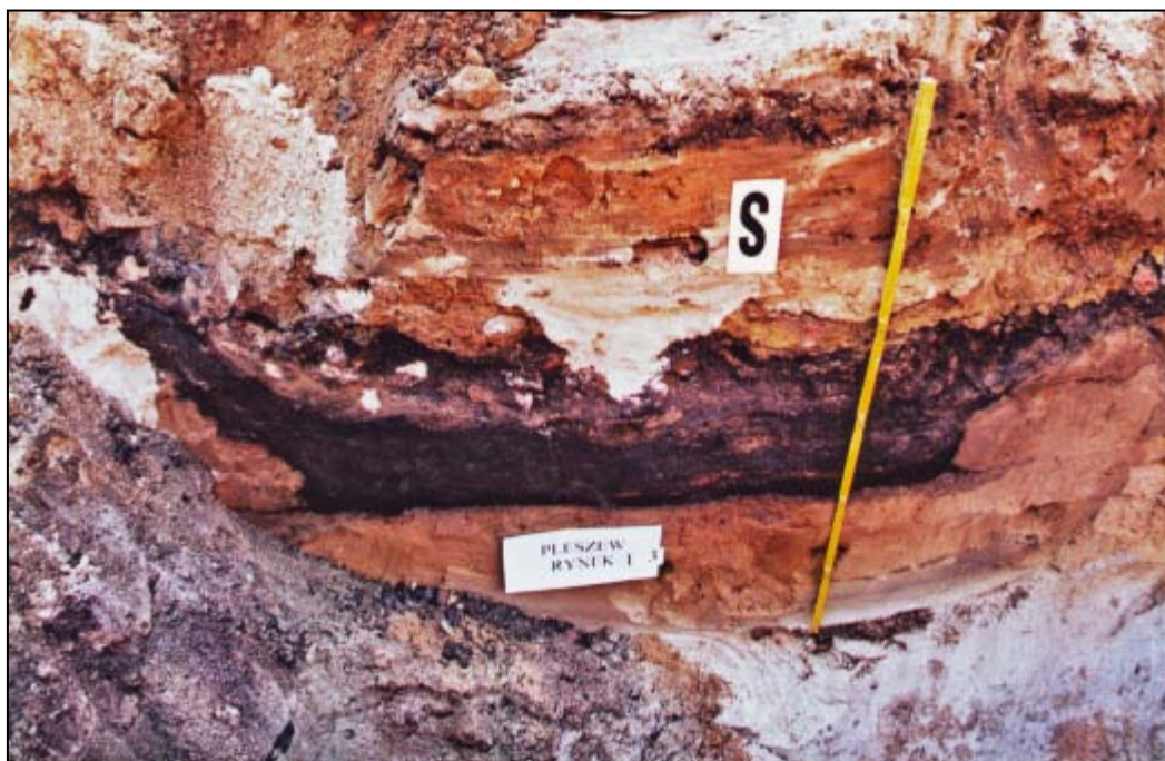
Rynek 13 – drewniana budowla zrębowa.