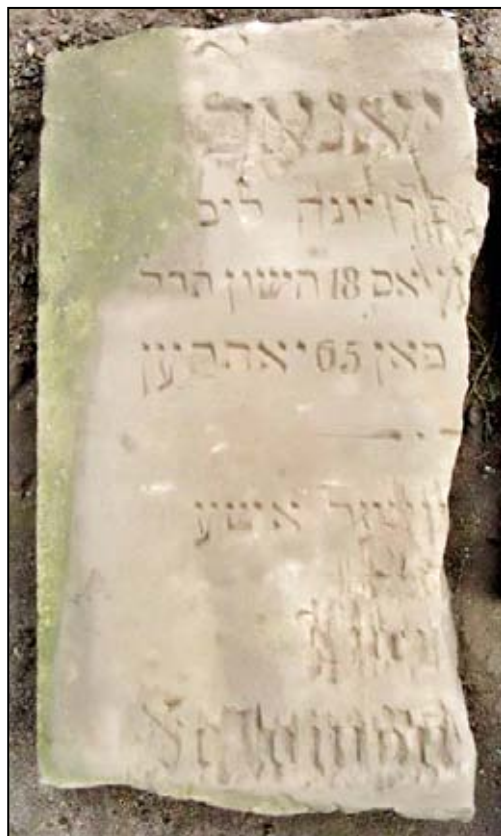
Jedna z maczew z pleszewskiego cmentarza